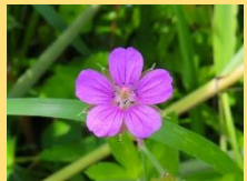
ゲンノショウコ(赤紫)