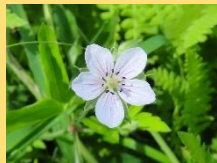
ゲンノショウコ(白)