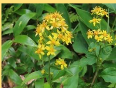
ミヤマアキノキリンソウ