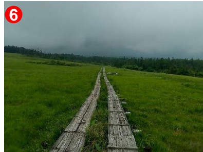
緩やかな傾斜湿原です。晴れていれば遠くの山々が見渡せます。