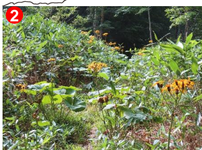
マルバタケブキの間を抜けるよう登山道が続いています。