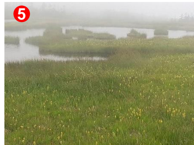
アヤメ平ではキンコウカも霧に覆われていました。