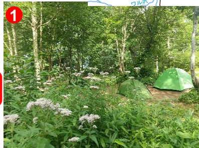
見晴キャンプ場に、ヨツバヒヨドリがたくさん咲いています。