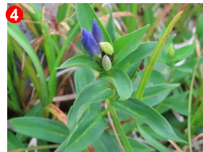
オヤマリンドウが一輪、見られました。