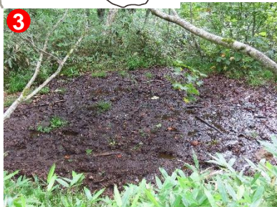
所々ぬかるんでいる箇所があります。ご注意ください。