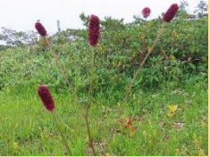
ミヤマワレモコウ