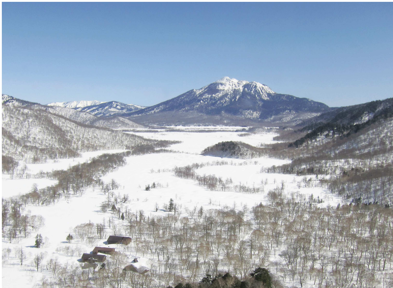
上空から尾瀬ヶ原と燧ヶ岳、会津駒ヶ岳を望む