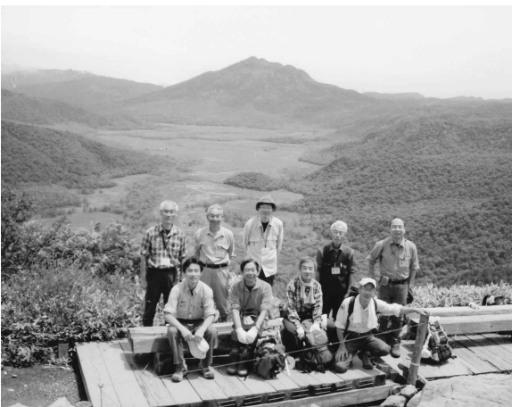
▲昨年の至仏山柵立てにて (H24.6.23 筆者は後列中央)

今年も尾瀬に感謝しながら、入山口啓発、至仏山柵立てや巡回清掃等に参加して行きたいと思えます。また、今年こそはまだ会えていない、オコジョや白い虹にも会いたいと思います。