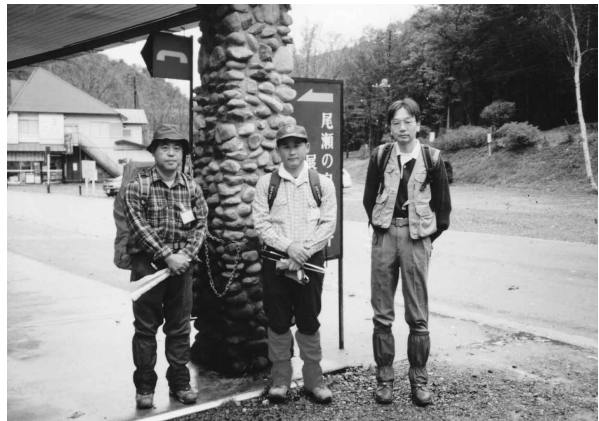
▲1998年の尾瀬クリーン大作戦にて (H10.10.18 筆者は右端)

もともと学生時代に公害防止関係の勉強をしていたので、自然保護には少し興味があったので、尾瀬でのボランティアを見つけては参加するようになりました。