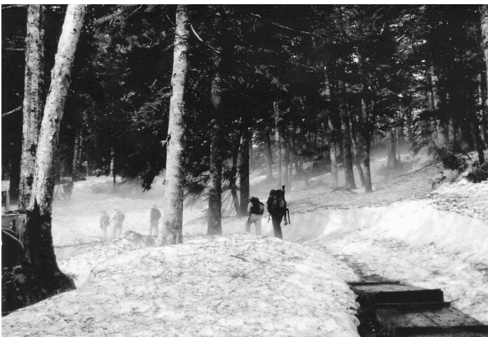
▲沼山峠の登山道 (H23.6.3)

州をつなぐ道の一つがこの沼のふちを通っていた。沼田街道と呼ばれるもので、上州の戸倉を最後として、会津の松枝岐に出るまで、全くの深い山の中の道であった。その心細い山道の途中で、山と沼と両々相映発した美しい風景にめぐりあった旅人の心持は、いかばかりであったらう。」と、上州側の街道は三平峠にもその面影が残っている。20万分の1図で測ってみると戸倉から尾瀬沼まで15キロメートル。尾瀬沼から檜枝岐まで14キロメートルと、そのほぼ中間に尾瀬沼と大江湿原が広がっており旅人感嘆せしめた情景をお客様に伝えている。