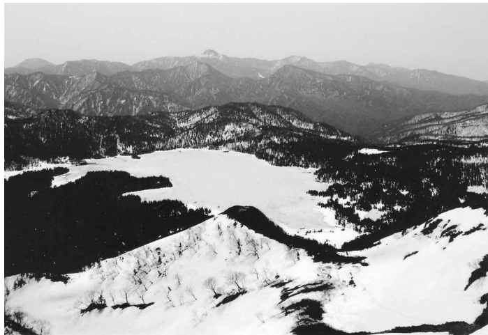
▲燧ヶ岳から望む尾瀬沼 (H20.5.4筆者撮影)

うか。原の中央に立つてかれを仰ぎ、これを眺めると、対照の妙を得た造化に感歎せざるを得ない。」とある。私は尾瀬ヶ原牛首分岐のテラスで休憩をとり、ここでお客様にこう伝えている。