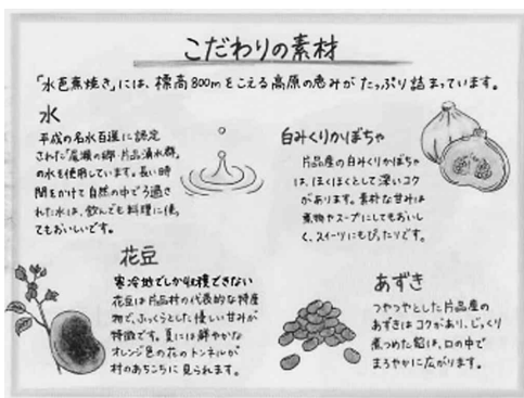
▲地元出身の大学生が作成したリーフレット（表面）

「地元の食材にこだわり、風味をなくさないように心掛けました。花豆は、火のとおり具合により、生になつてしまひ何度も失敗しました。ザゼンソウのように焦げて茶色なつてしまったことも何度もありましたが、試行錯誤して出来上がった時の感動は大きかったです。」と水芭蕉焼