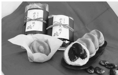
▲1個130円にて販売