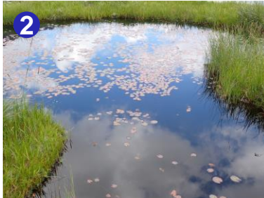
2 沼尻では池塘の周囲を散策できます。お花や他の生き物たちをお楽しみください。