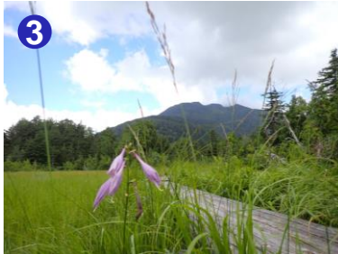
3 小沼湿原からも燧ヶ岳を望むことができます。