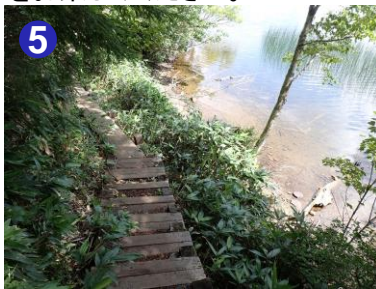
5 尾瀬沼南岸の道は沼畔を歩くところもあります。涼やかな木陰と水辺の道を進みながら、尾瀬沼越しの燧ヶ岳の雄大な姿を楽しんでみてはいかがでしょうか。