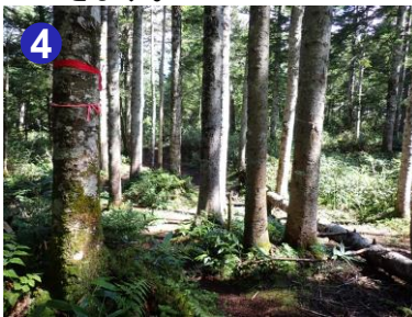
4 大清水へ向かう登山道は、倒木が多く見られます。テープ等を目印に進みましょう。