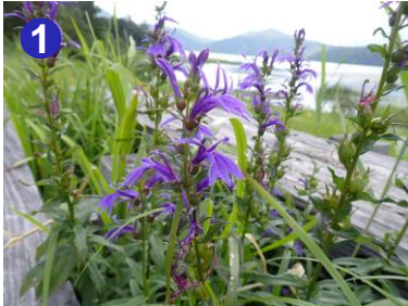
1 尾瀬沼北岸の湿原では、木道沿いにサワギキョウを見ることができます。