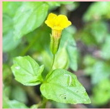
オオバミゾホズキ