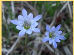
タテヤマリンドウ