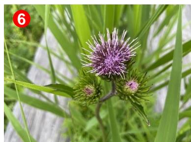
6 オゼヌマアザミがたくさん咲いていました。