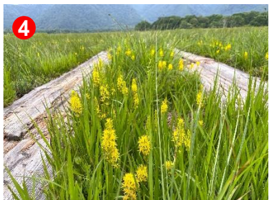
4 木道が低いのでまるでキンコウカロードでした。