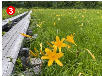
3 シカ柵の中で、ニッコウキスゲの花がまだ咲いていました。