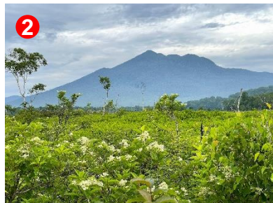
2 下の大堀川ミズバショウ群生地の東側でリウツギが咲いていました。