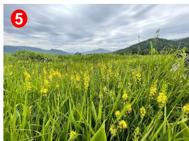
5 尾瀬ヶ原の至る所でキンコウカの群生が見られます。