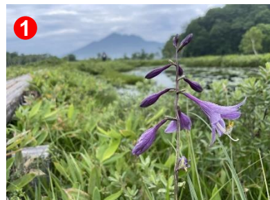
1 燧ヶ岳をバックにコバギボウシの花。湿原で咲き出しています。