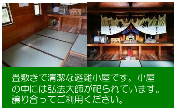
田代山避難小屋 (弘法大師堂)

畳敷きで清潔な避難小屋です。小屋の中には弘法大師が祀られています。譲り合ってください。