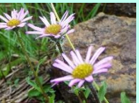
ジョウシュウアズマギク