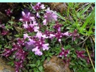
イブキジャコウソウ