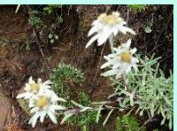
ホソバヒナウスユキソウ