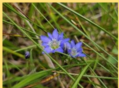
タテヤマリンドウ