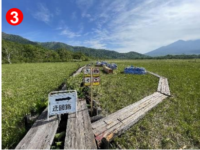
3 木道を新しく交換工事中です。迂回路では気を付けて歩きましょう。