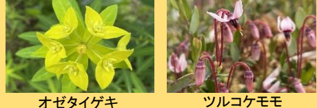
オゼタイゲキ ツルコケモモ