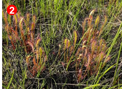
2 食虫植物のナガバノモウセンゴケの群生で湿原が赤く見えます。