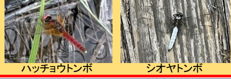
ハッチョウトンボ シオヤトンボ