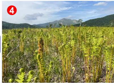
4 ヤマドリゼンマイが葉をたくさん広げ始めていました。