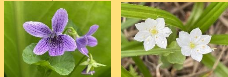
オオバタチツボスミレ ツマトリソウ