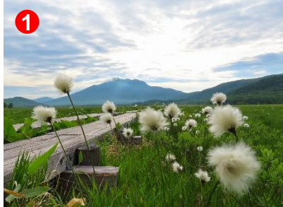
1 東方向を見ると燧ヶ岳をバックにワタスゲの果穂が揺れていました。