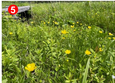
5 ミヤマキンポウゲが水の流れて沿って群生していました。