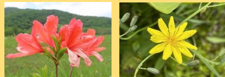
レンゲツツジ ハナニガナ