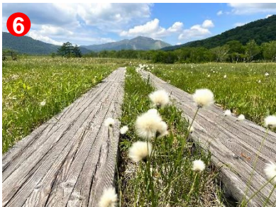
6 ワタスゲの果穂の群生は尾瀬ヶ原の至る所で見られます。