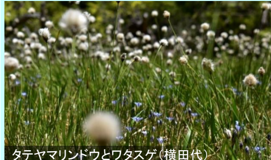
タテヤマリンドウとワタスゲ(横田代)