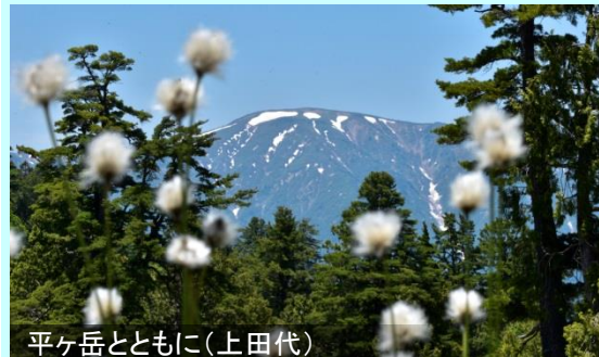
平ヶ岳とともに(上田代)