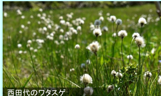
西田代のワタスゲ