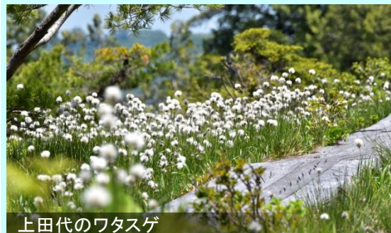
上田代のワタスゲ