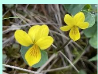
ジョウエツキバナノコマノツメ