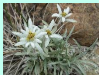
ホソバヒナウスユキソウ