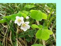
コミヤマカタハミ