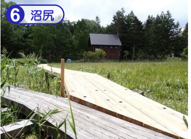
沼尻トイレ及び休憩所は、マナーを守って清潔にご利用ください。