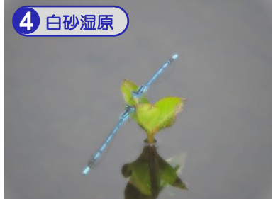
湿原では数多くの美しいトンボが見られます。静かに見ていると近くに寄ってくることもあります。