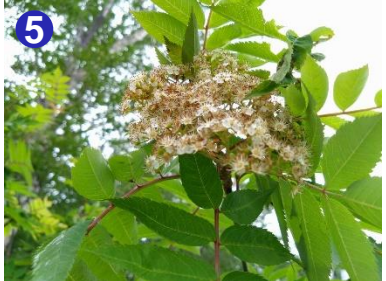
上を見るとナナカマドの花が咲き始めていました。花から紅葉まで、長く楽しめる植物です。