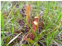
ナガバノモウセンゴケ