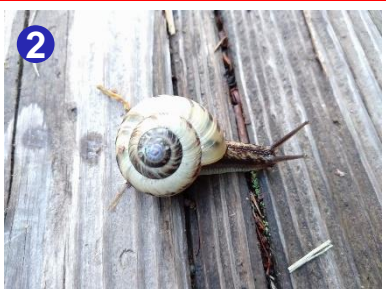
雨上がりには木道の上に、マイマイの姿を見ることができます。踏まないよう気を付けてください。