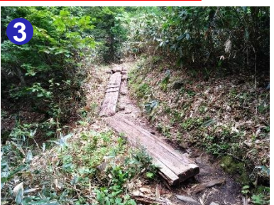
傷んでいたり、傾いていたりする木道があります。通過する際は慎重に歩いてください。