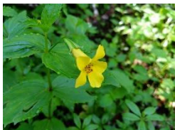
オオバミゾホオズキ