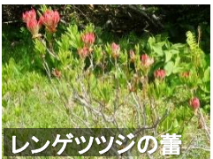
レンゲツツジの蕾