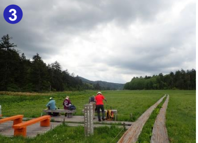
小淵沢田代分岐にもベンチが設置されています。大江湿原の初夏の風景をお楽しみください