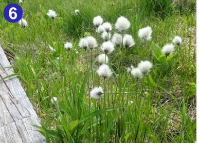
大江湿原ではワタスゲの果穂がフワフワしてきました。もうじき見頃を迎えそうです。