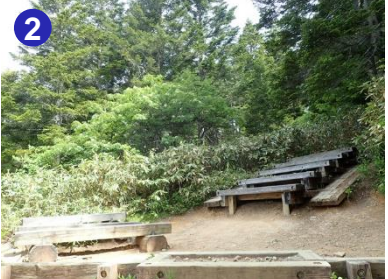
大江湿原まで、樹林帯の木道が続きます。沼山峠のベンチで休憩しましょう。