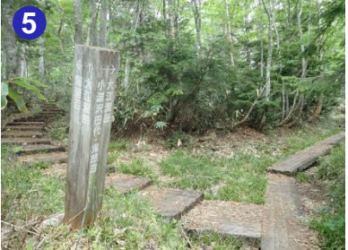
分岐から大江湿原に下ると約40分、尾瀬沼まで下ると約1時間となります。