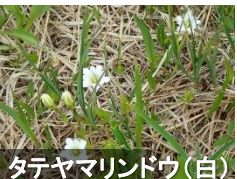
タテヤマリンドウ(白)

ツキノワグマについて 尾瀬はツキノワグマの 生息地です。 クマ鈴などで人の存在を 知らせましょう。