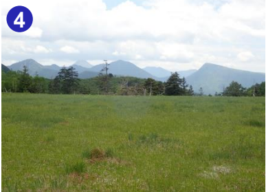
湿原の向こうに日光白根山など日光の山々を望みながら、静かな湿原で休憩をとることができます。