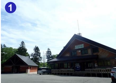
沼山峠登山口には、清涼飲料水の自動販売機がある無料休憩所と公衆トイレがあります。

沼山峠登山口からの 最終バスについてのご案内 会津高原尾瀬口駅行 最終バス 15:50 発 御池駐車場・道の駅尾瀬檜枝岐行 最終バス 17:00 発