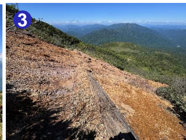
3 8合目にガレ場をトラバースするところがあります。浮き石に注意して慎重に歩きましょう。