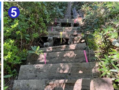
5 破損している階段がいくつかあり、がたつきます。足元に気をつけて通行してください。