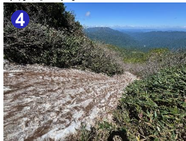
4 200m程度の雪渓歩きがあり、軽アイゼン等をつけて慎重に通過してください。