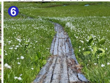
6 広沢田代のワスゲが見頃を迎えていました。