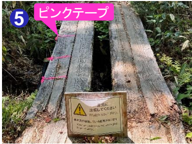
5 ピンクテープが結ばれている木道は破損しています。避けてお通りください。