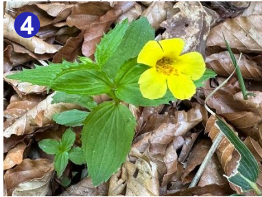
4 イヨドマリ沢の周辺には、オオバミゾホオズキが咲き始めました。花は3cm程の大きさです。