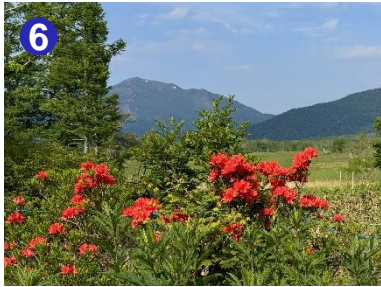
6 樹林帯を抜けて見晴に出ると、オレンジ色の鮮やかなレンゲツツジが見頃を迎えていました。