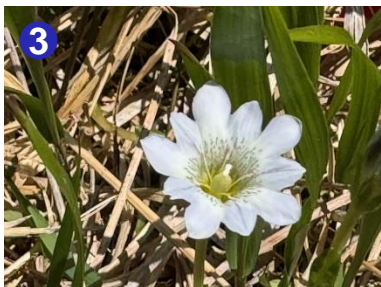
3 白砂湿原にタテヤマリンドウがたくさん咲いていました。めずらしい白花を見つけました。