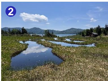
2 沼尻平の湿原には尾瀬沼周辺で、唯一見られる池塘があります。