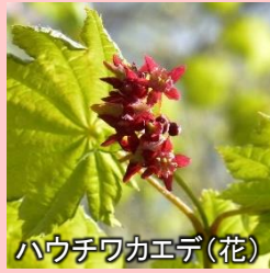
ハウチワカエデ(花)