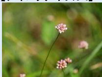
【アキノウナギツカミ】