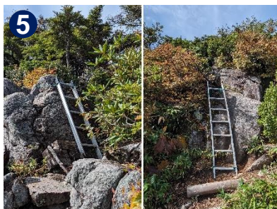
5 山頂直下に大岩に掛けた二つのハシゴがあります。足を踏み外さないように慎重に登りましょう。