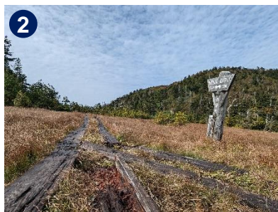
2 小田代湿原まで来ると田代山の頂が見えてきます。山頂まではあと500mです。一休みしましょう。