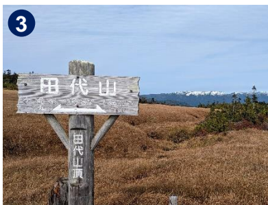
3 冠雪した会津駒ヶ岳等を見ることができました。周回木道は一方通行なのでご注意ください。