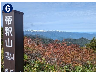
6 冠雪した燧ヶ岳や那須連山、日光の山並みも見ることができます。素晴らしい眺望をお楽しみ下さい。