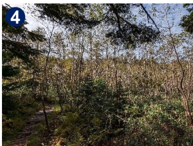
4 ダケカンバの若木の林を通り抜けると、帝釈山までのほぼ中間地点です。焦らずゆっくり歩きましょう。