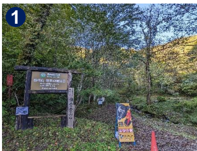
1 山頂までは約2km、約2時間です。木々の色づきを楽しみながら、ゆっくり登り始めましょう。

10月6日は初雪が降りました。登山道は整備されて歩きやすくなっていますが、スリッパにご注意ください。山頂湿原の紅葉、眺望をお楽しみ下さい。草