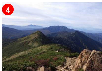
4 至仏山頂付近から見た小至仏山・笠ヶ岳方面です。