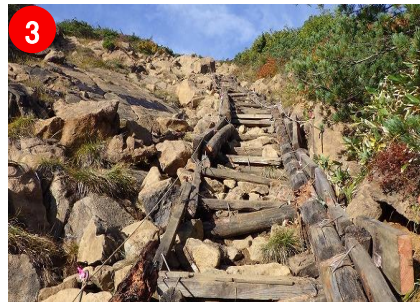
3 傾いた木製階段が修復されていました。