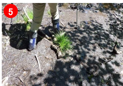
5 笠ヶ岳までの登山道はぬかるみが多いので注意して下さい。