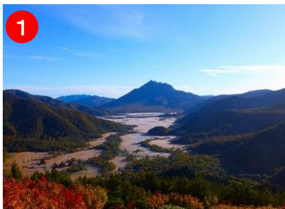
1 東面登山道では尾瀬ヶ原の景色を見ながら登ることができます。

山頂に積雪が見られるときは、標高が上がるほど雪山の様相になります。登山口付近が雨でも、山頂付近は雪になり、西からの冷たい強風も吹きつけ、視界も悪くなります。道迷いや低体温症の危険があるので、自身の体力と経験から無理をされないようお願いいたします。