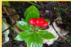
ゴゼンタチバナ(実)