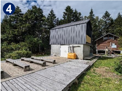
山頂には綺麗なトイレと避難小屋、休憩できるベンチがあります。ゆっくりとランチはいかがですか。