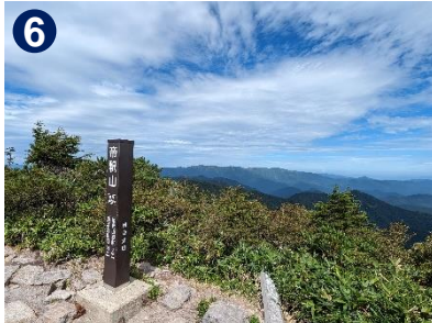
素晴らしい帝釈山からの眺望。燧ヶ岳や日光の山並みも見ることができます。