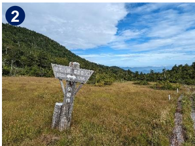
田代山の山頂まで500mという地点にあるキンコウカが咲く小田代湿原。山頂まであと少しです。