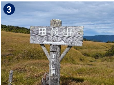
山頂は周囲の山が見渡せる広大な湿原です。周回できる木道は一方通行なのでご注意ください。