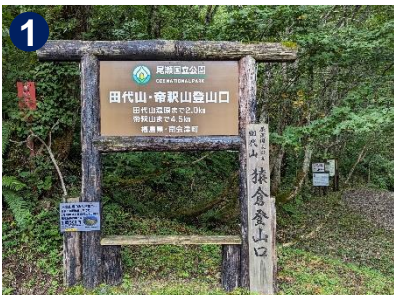
猿倉登山口までは県道350号から分岐し、約13kmほど砂利道となります。ゆっくり走行しましょう。