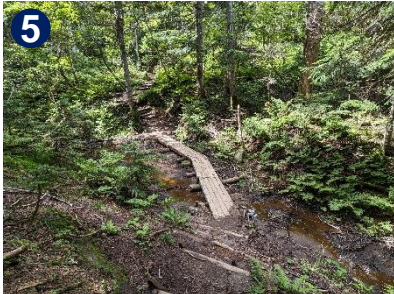
登山道はとても良く整備されており、大変歩きやすいです。2箇所梯子があるのでご注意ください。