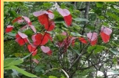
オオカメノキ(紅葉)