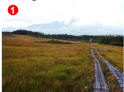
1 横田代では、草紅葉が進んでいました。