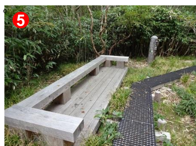
5 道標地点(土場)です。長沢新道唯一のベンチです。