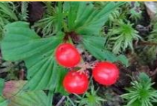
ゴゼンタチバナ(実)