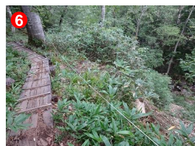
6 木道脇斜面が崩れています。注意してご通行ください。