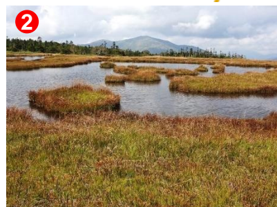
2 草紅葉の湿原と大きな池塘、至仏山や燧ヶ岳などが見られます