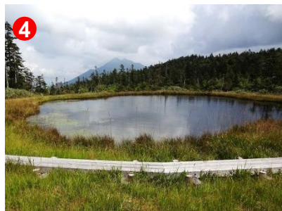
4 長沢新道分岐地点には燧ヶ岳の写る大きな池塘があります。