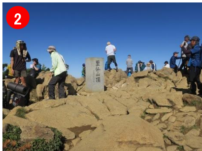
2 秋晴れの山頂では、たくさんの登山客で賑わっていました。