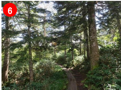
6 オヤマ沢田代～鳩待峠間では爽やかな森歩きが楽しめます。