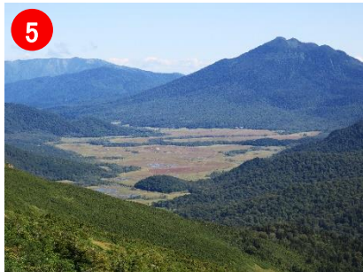
5 原見岩から見た尾瀬ヶ原です。草紅葉がすすんできました。