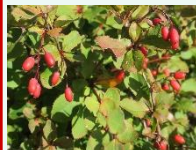
マルバヘビノボラス