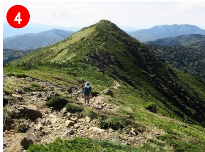
4 至仏山～小至仏山間は、気持ち良い稜線歩きが楽しめます。