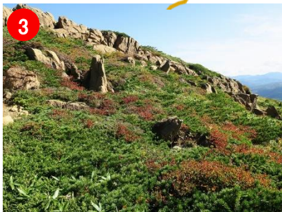
3 至仏山南側斜面では、ハイマツの緑とツツジの紅葉が鮮やかです。