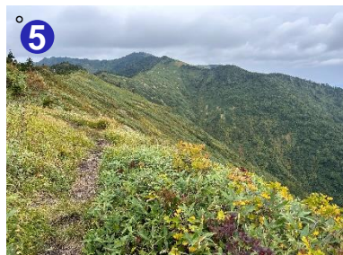
5 駒の小屋から大津岐峠までは秋色に染まった草木の稜線歩きを楽しめます。