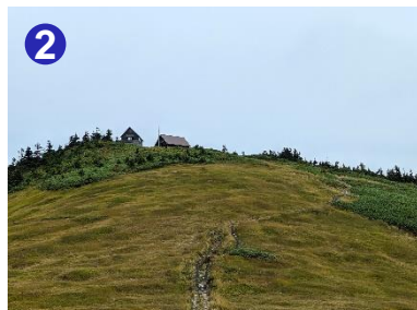
2 稜線に上がると駒の小屋が見えてきます。手前のベンチで休憩して景色を楽しみましょう