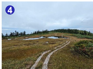
4 中門岳のピークは標識の先にあります。空が映りこむ大池のベンチで一休みしましょう。