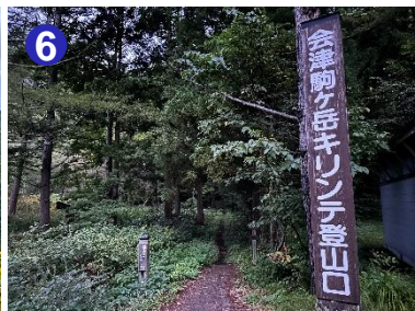
6 駐車場はありませんのでご注意ください。傾斜の緩いつづら折りの道が続きます。

【今日の尾瀬沼】 天気：曇り一時雨 最高気温：18.9℃ 最低気温：9.8℃ 日の出：5時33分 日の入：17時35分