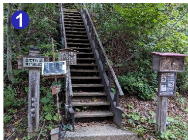
1 滝沢登山口から暫くはつづら折りの急登が続きます。足元に注意して歩きましょう。

秋空のもと、会津駒ヶ岳の 気持ちのいい稜線歩きを楽 しんでみませんか。 木道も改修され歩き易くな りました。