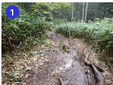
1 長英新道の2合目付近までは、ぬかるみは何力所かあります。特に雨の後などは要注意です。