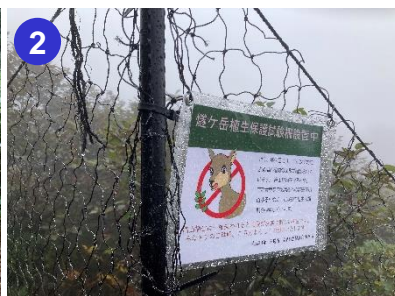
2 8合目付近に植生保護のための柵が登山道ぎりぎりまで設置されています。注意して通行してください。