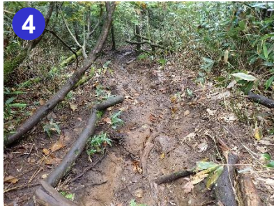
4 見晴新道も2合目付近にぬかるみがあります。スパッツなどがあったほうがいいですね。