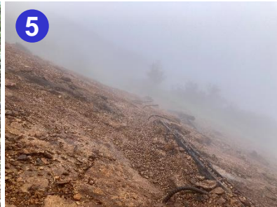
5 御池からの登山道は8合目と9合目の間にザレ場をトラバースする所があります。慎重に歩きましょう。