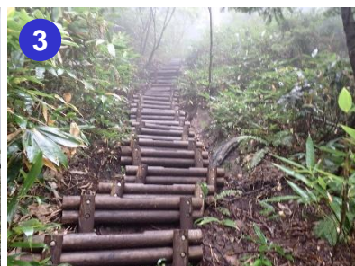
3 見晴新道の7合目付近は階段が連続する所があります。足元を見て踏かないようにしてください。