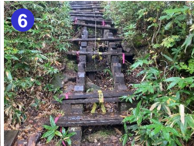
6 破損している階段がいくつかあります。足元には十分気をつけて上り下りしてください。