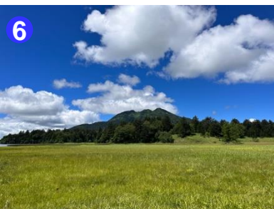
大江湿原から望む燧ヶ岳は、雄大です。北海道、東北一の標高を誇る日本百名山です。