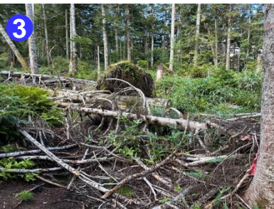
大清水への登山道は倒木があります。赤いマーキングを目印に進みましょう。