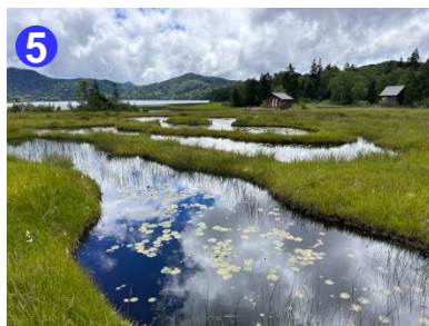
尾瀬沼で唯一、池塘を見られる湿原です。ヒツジグサの葉が赤く色づいてきました。