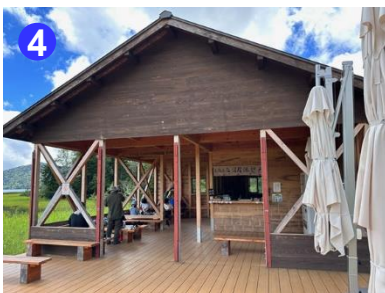
沼尻休憩所と公衆トイレが利用できます。トイレは清掃に水が使えないためきれいに使しましょう。