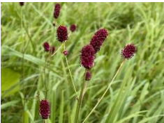
ミヤマワレモコウ