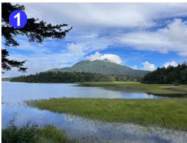
第2展望デッキは燧ヶ岳を望むビュースポットです。風のない日は逆さ燧を望めます。