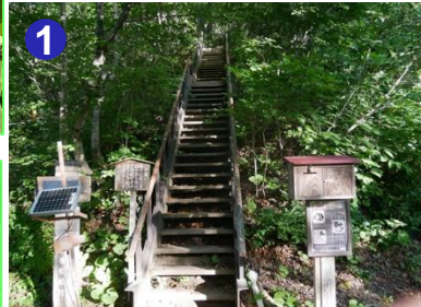
1 滝沢登山口は急な階段から登り始めます。その後、しばらく急登が続きます。