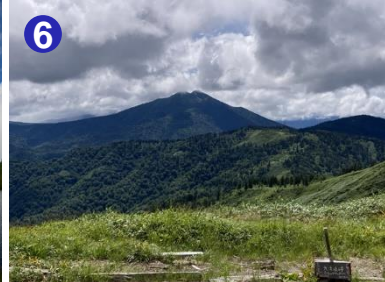
6 大津岐峠から見た燧ヶ岳です。尾瀬沼から見る姿との違いを楽しむことができます。