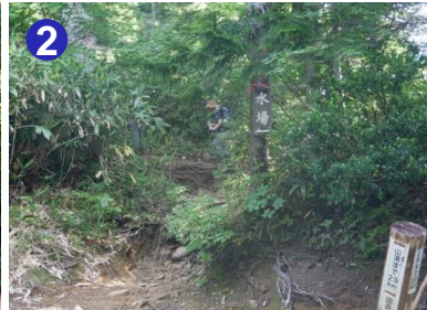
2 急な坂道を5分ほど下った所に水場があります。冷たくて美味しい水で喉が潤います。