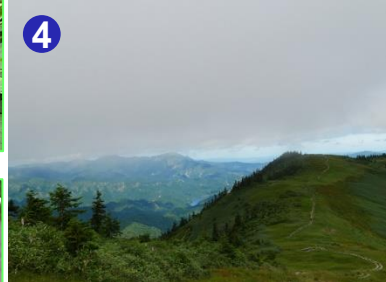
4 山頂から中門岳へ続く稜線からは、越後駒ヶ岳など新潟の山々を望むことができます。