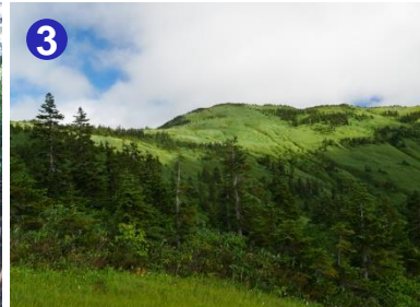
3 樹林帯を抜けた先に会津駒ヶ岳を望むことができる湿原があります。