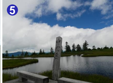
5 中門岳の大池は、青空が映り込み、気持ちのよい休憩場所です。