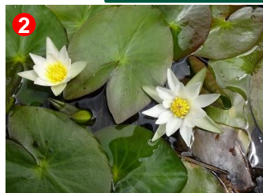
2 この辺りではヒツジグサの花を間近に見ることができます。