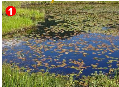
1 池塘のヒツジグサの葉が色付き始めました。