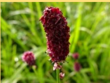
ミヤマワレモコウ