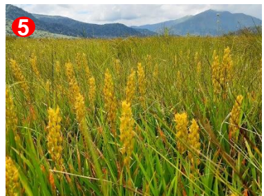
5 黄葉し始めたキンコウカがたくさん見られます。