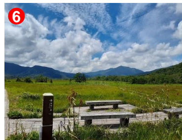
6 赤田代では、静かな尾瀬をお楽しみいただけます。