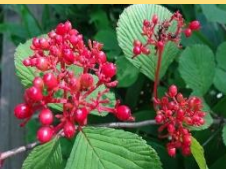
ケナシヤブデマリの実