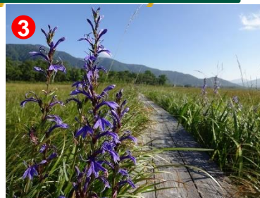
3 サワギキョウは多くの場所で見ることができます。