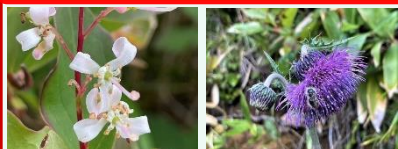
ホツツジ ジョウシュウオニアザミ