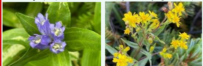
オヤマリンドウ ミヤマアキノキリンソウ