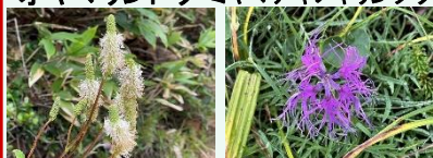
タカネウウチソウ タカネナデシコ