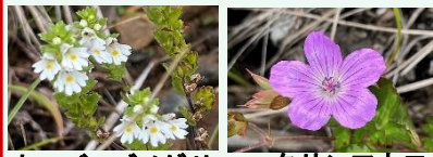
ホソバコメガス ハクサンフウロ