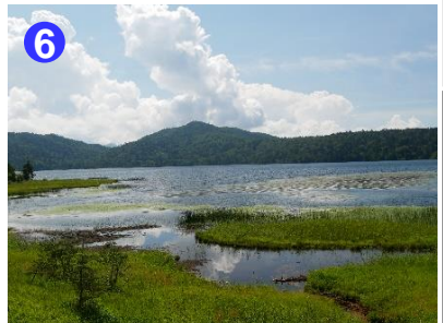
6 北岸の小さな湿原からみた尾瀬沼です。何気ない風景にも心が癒やされます。