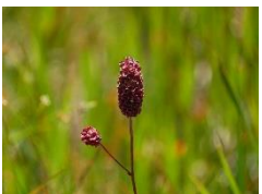
ミヤマワレモコウ