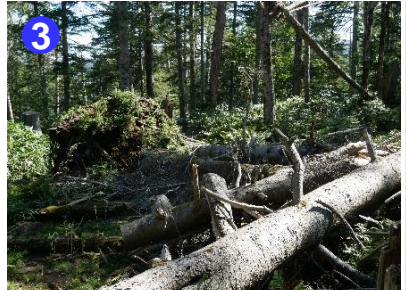
3 大清水平への登山道には倒木があります。踏み跡に沿って回り込むように進みましょう。