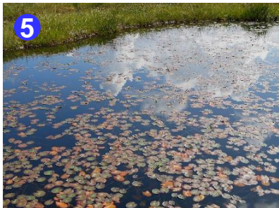
5 尾瀬沼周辺で唯一池塘がある沼尻。ヒツジグサの葉も色づき始めています。