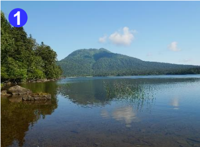
1 南岸から見る燧ヶ岳です。東岸から見るのとは少し形が違います。