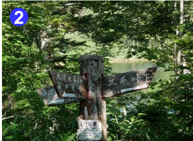
2 大清水平への分岐。道標が林の中にありますので、見落とさないよう注意してください。