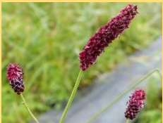
ミヤマワレモコウ