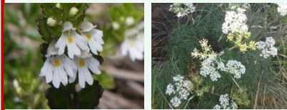
ホンパコメグサ ミヤマウイキョウ

植生保護と登山者の安全対策のため、東面登山道（森林限界より上）は上り専用となっています。至仏山山頂から山ノ鼻へは下りすることはできません。ご注意ください。