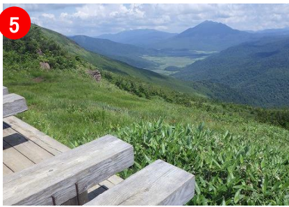
5 ベンチでゆっくり休憩を取り展望をお楽しみください。