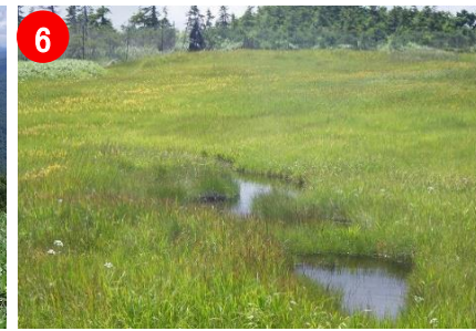
6 オヤマ沢田代では、キンコウカが見頃を迎えています。