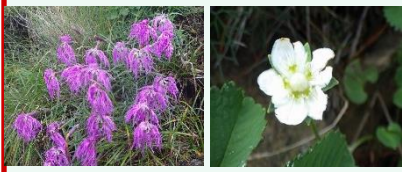
タカネナデシコ ウメバチソウ