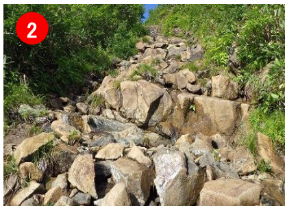
2 濡れた蛇紋岩は特に滑りやすいのでご注意ください。