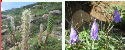
タカネトウウチソウ ヒメシャジン