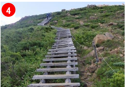
4 登山道から踏み出さないよう植生保護にご協力ください。