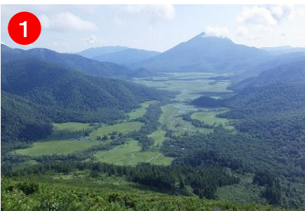
1 森林限界を抜けると、大展望が開けます。