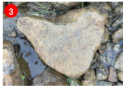
3 東面登山道名物のハート形蛇紋岩、是非見つけてみて。