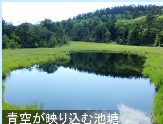
青空が映り込む池塘