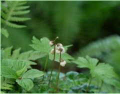
コバノイチヤクソウ