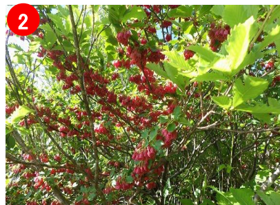
【ベニサラサドウダン】が咲いていました。