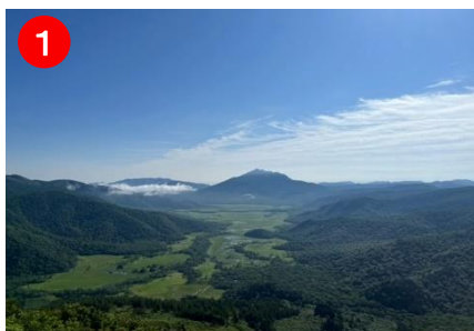
東面登山道では尾瀬ヶ原の景色を見ながら登ることができます。