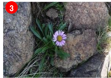
【ジョウシュウアズマギク】高天ヶ原付近で見つけました。