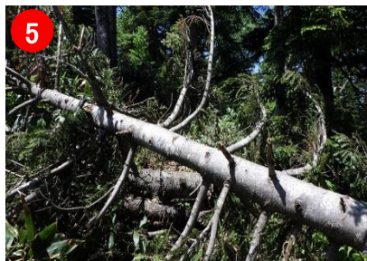
笠ヶ岳方面へは倒木やぬかるみが多いのでご注意ください。