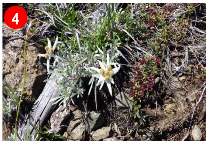
【ホソバヒナウスユキソウ】エーデルワイスの近縁です。