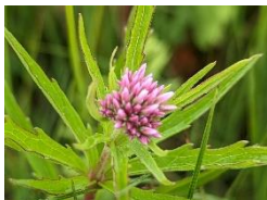
サケバサワヒヨドリ