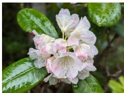
ハクサンシャクナゲ