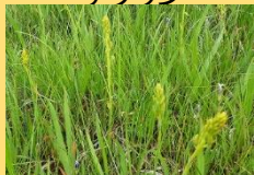
キンコウカ(つぼみ)