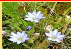
タテヤマリンドウ