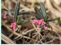
【コヨウラクツツジ】