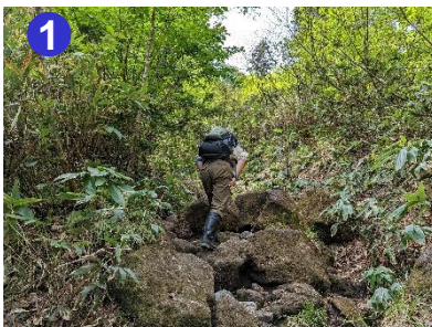
しばらく岩場が続きます。転倒しないように足元を確認しながら進みましょう。