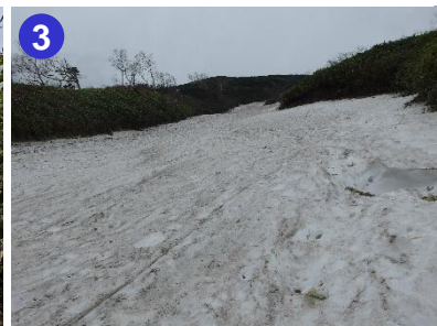
長い雪渓の登り降りでは、登山道の接続点が見えにくい箇所があります。特に下り過ぎにはご注意ください。