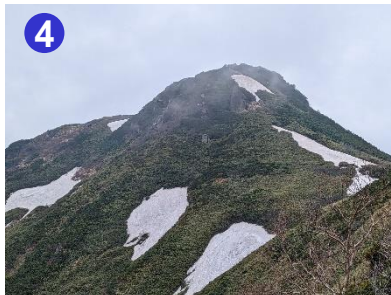
柴安嶺東面の登山道の斜面には残雪が張り付いています。滑り止め等を装備し注意して歩行ください。