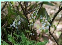
【タテヤマリンドウ】