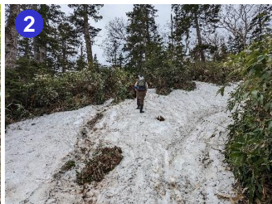
残雪と登山道が交互に連続します。踏み抜きやスリップに注意して慎重に歩きましょう。