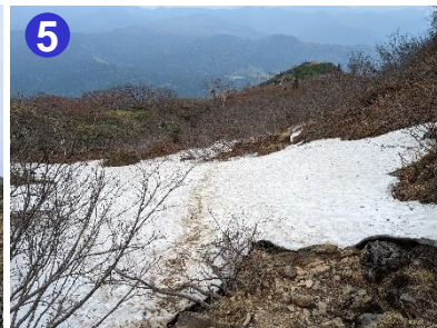
短い雪渓を横断する箇所があります。スリップに注意して歩きましょう。