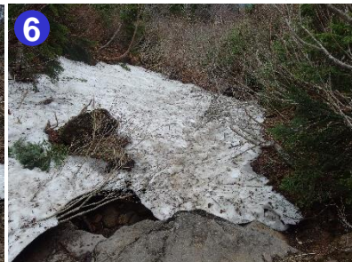
雪が残っている箇所があります。踏み抜きやスリップに注意して歩行ください。