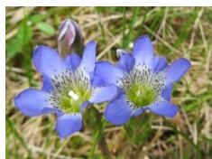
タテヤマリンドウ