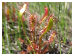
ナガバノモウセンゴケ