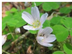
コミヤマカタバミ

残雪期のナデッ窪は雪崩などの危険があるため、通行は控えてください。 〈尾瀬沼地区運営協議会〉