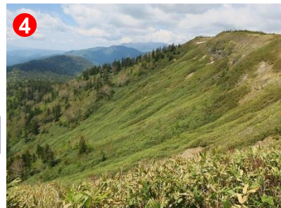
4 富士見下よりアヤメ平方面、滝雲が見られるスポットです。