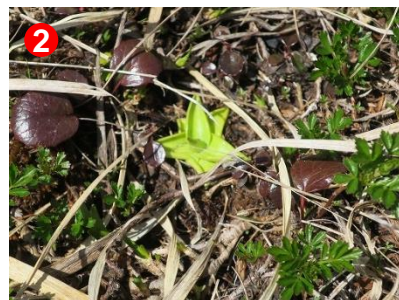
2 アヤメ平に、ムシリスミレの若芽が出ていました。