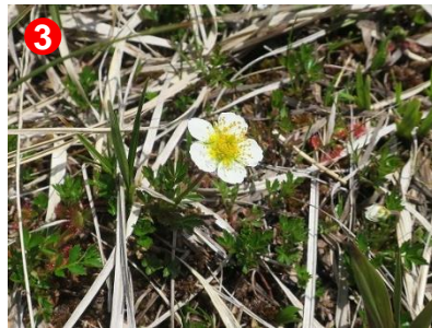
3 アヤメ平では、チングルマが咲き始めました。