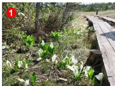
1 横田代の入口には、まだミズバショウの群落が見られます。