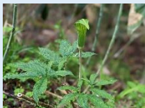
【オククルマムグラ】