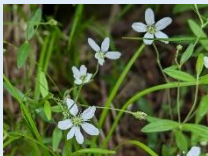
【コミヤマカタバミ】