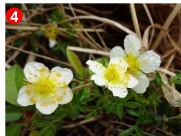
4 竜宮十字路の近くにチングルマが咲いていました。