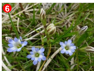
6 タテヤマリンドウはあちらこちらに咲いています。