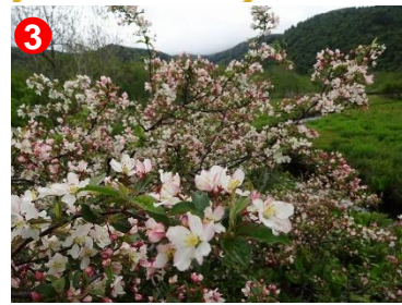
3 ズミが白い小さな花をたくさんつけました。