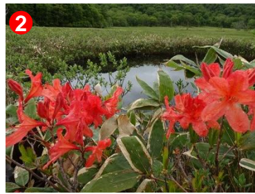
2 レンゲツツジの花があちこちで咲き始めました。