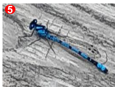
5 木道周辺でイトトンボをいくつか見ました。