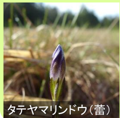
タテヤマリンドウ(蕾)