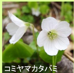
コミヤマカタバミ