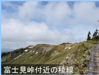
富士見峠付近の稜線