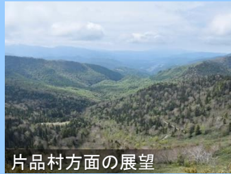
片品村方面の展望