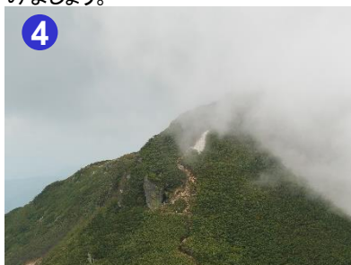
4 柴安峠東斜面の残雪は少なくなりましたが、滑り止め等を装備し、注意して歩いてください。