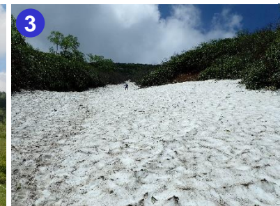
3 8合目手前には長い雪渓があります。軽アイゼンを装着するなどして慎重に通過してください。