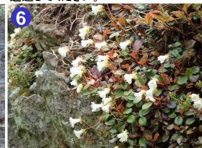
6 見晴新道ではヒメイワカガミが岩肌にびっしりと咲いていました。