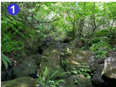
1 登り始めてしばらく岩場が続きます。転倒しないように足元を確認しながら進みましょう。