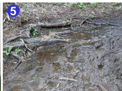
5 長英新道ではくるぶしまで埋まるようなぬかるみが数か所あります。足元に注意して通行してください。