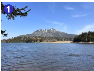
1 長蔵小屋裏の尾瀬沼と燧ヶ岳を望めるビュースポットです。風の無い時は逆さ燧が楽しめます。