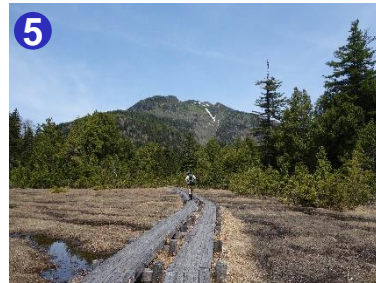
5 小沼湿原から望む燧ヶ岳です。湿原では、植物の芽吹きが始まっています。