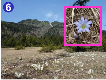
6 沼尻では、ミズバショウ、タテヤマリンドウ、ショウジョウバカマが咲き始め、モウセンゴケがみられました。