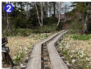
2 釜ヶ堀湿原のミズバショウの群落が見頃を迎えています。