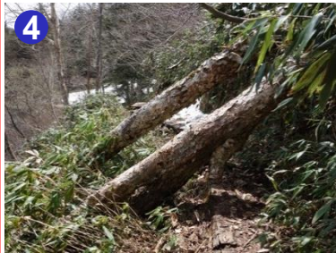
4 南岸には倒木があり危険です。ザックを引っかけて転倒しないよう気を付けて通行してください。