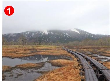
水量が多く池塘に映る逆さ至仏山を見ることができます。