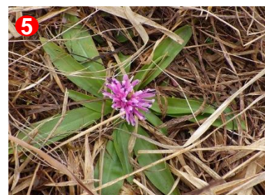
ショウジョウバカマが咲き始めていました。