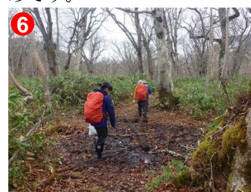
登山道は泥濘が多く、標高の高い樹林帯には雪が残っています。