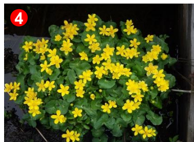
木道の上にリュウキンカがたくさん咲いていました。