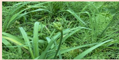
ニッコウキスゲ(蕾)