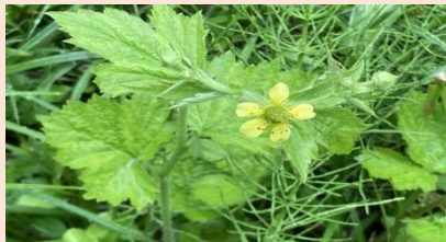
カラフトダイコンソウ