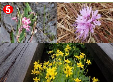
5 見られる花の種類が増えました。