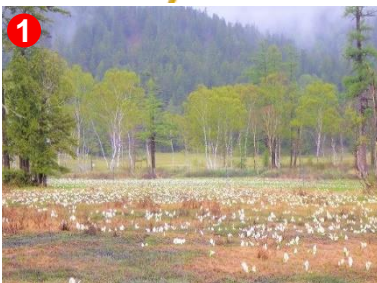
1 上田代付近のミズバショウの様子です。