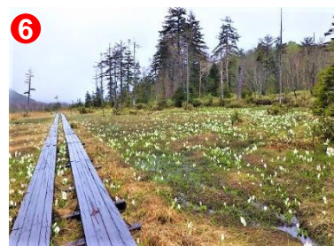
6 見晴～東電分岐間にも、ミズバショウの群落があります。