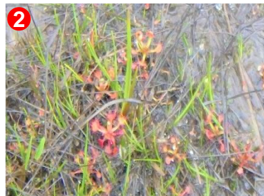
2 湿原をよく見ると、小さなモウセンゴケが見られます。