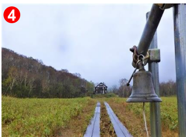
4 クマ鐘が設置されている所では、人間の存在を知らせるため鳴らしてください。